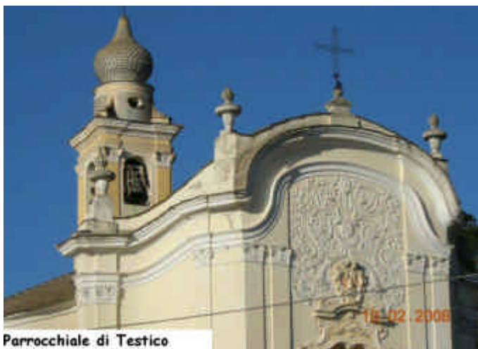
Parrocchiale di Testico

rata: in pratica un immenso uliveto che dal fondovalle si estende fino al paese sulla costa.