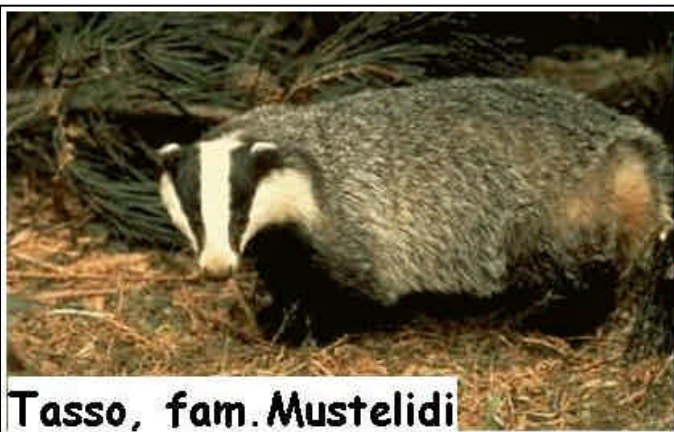
Tasso, fam. Mustelidi

Questo animale, protetto dalle leggi sulla caccia perché rischiava l'estinzione a causa delle sue carni prelibate, ora è in grande sviluppo ed è concausa, assieme ai cinghiali, dell'aratura di diversi orti.